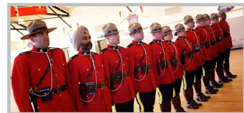
Форма канадской конной полиции не меняется больше 50 лет. Она соответствует форме драгунских канадских полков, входивших в состав армии Британской империи.