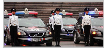
Женский батальон дорожной полиции Шаньдуня. Эта форма по праву считается самой красивой среди всей китайской полиции.