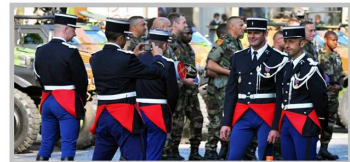
Парадная форма французских жандармов не меняется уже в течение двух десятков лет. Повседневная отличается от нее отсутствием кителя и укороченными сапогами.