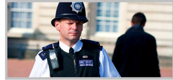
Самой экстравагантной деталью в обмундировании британской полиции до сих пор остаются шляпы. Все остальное скрыто под темно-синими жакетами или свеетонажными куртками.