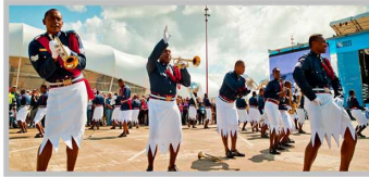
Полицейские острова Фиджи перед туристами. Белые юбки с разрезами по подолу — стилизация одежды местных воинов 15-17 веков.

Предлагаем вниманию наших читателей фоторепортаж о том, какая необычная, красивая, эlegantная полицейская форма одежды существует в наши дни.