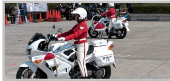
Представительница женского мотоциклетного батальона японской дорожной полиции (Токио).