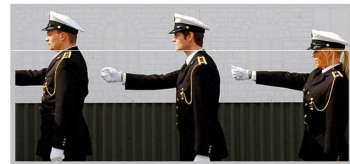
Парадная форма полиции Исландии — почти полная копия формы британских военно-морских офицеров 40-х годов XX века.