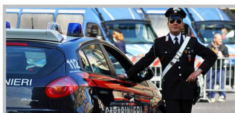
Итальянский карабинер. Одет в повседневную форму.