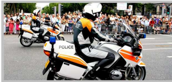
Мотocyклетный полк полиции Люксембурга выполняет функции почетного эскорта, а в остальное время несет службу на улицах города. Парадная и повседневная форма мотоциклистов ничем не отличаются.