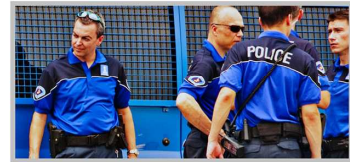
Швейцарские полицейские кителями и форменным рубашкам предпочитают сине-голубое поло.