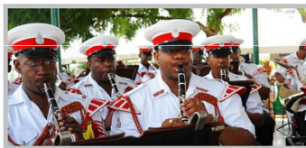
Сводный оркестр полиции Барбадоса. Повседневная форма полицейских этого островного государства от парадной отличается только отсутствием красных жакетов.