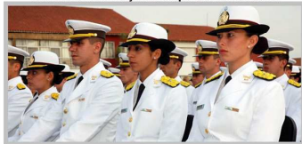
Парадная форма аргентинской полиции напоминает форму морских офицеров первой половины 20 века. Повседневная тоже полностью белая, но без золотых погон.